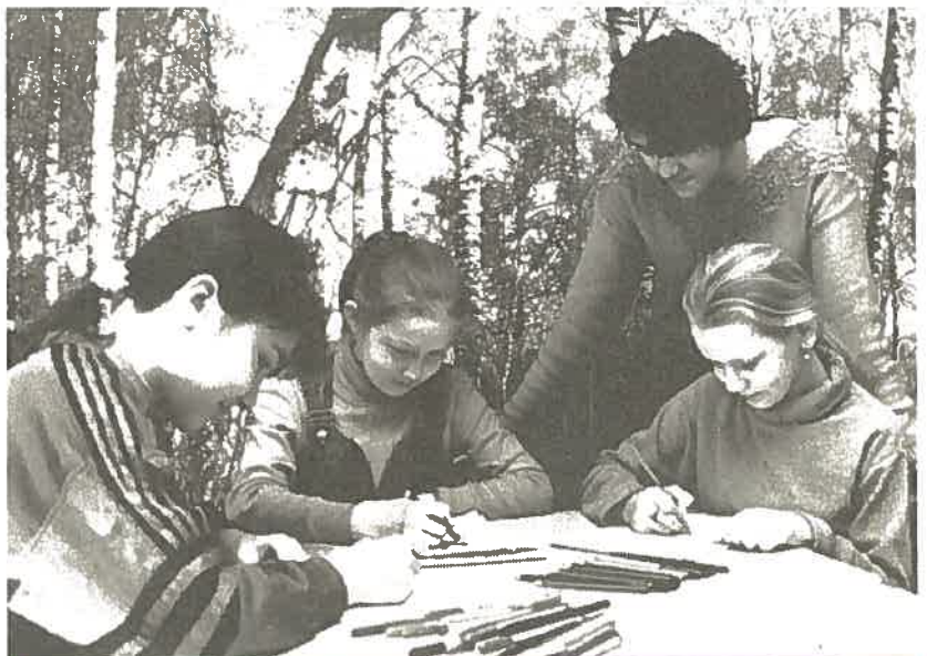
На снимке: юные художницы в кружке рисования клуба «Надежда».