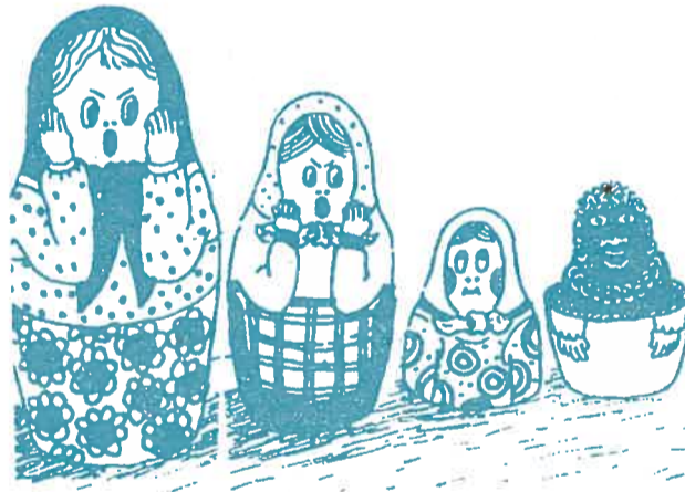
Рис. А. Фролова

дала его черной кормилице. И в итоге наш сын стал черным...» Мать пишет своему сыну Джорджу: «Дорогой Джордж! Когда ты родился, у меня тоже не было своего молока, и я кормила тебя молоком коровы. Но рога у тебя выросли только к двадцати пяти годам...»