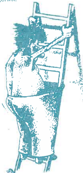
Рис. Н. Рачкова.

И вливалась молитва в святую капель Той, великой весны про- буждения, И на мертвую Русь опу- скалась купель Для грядущего новорож- дения.