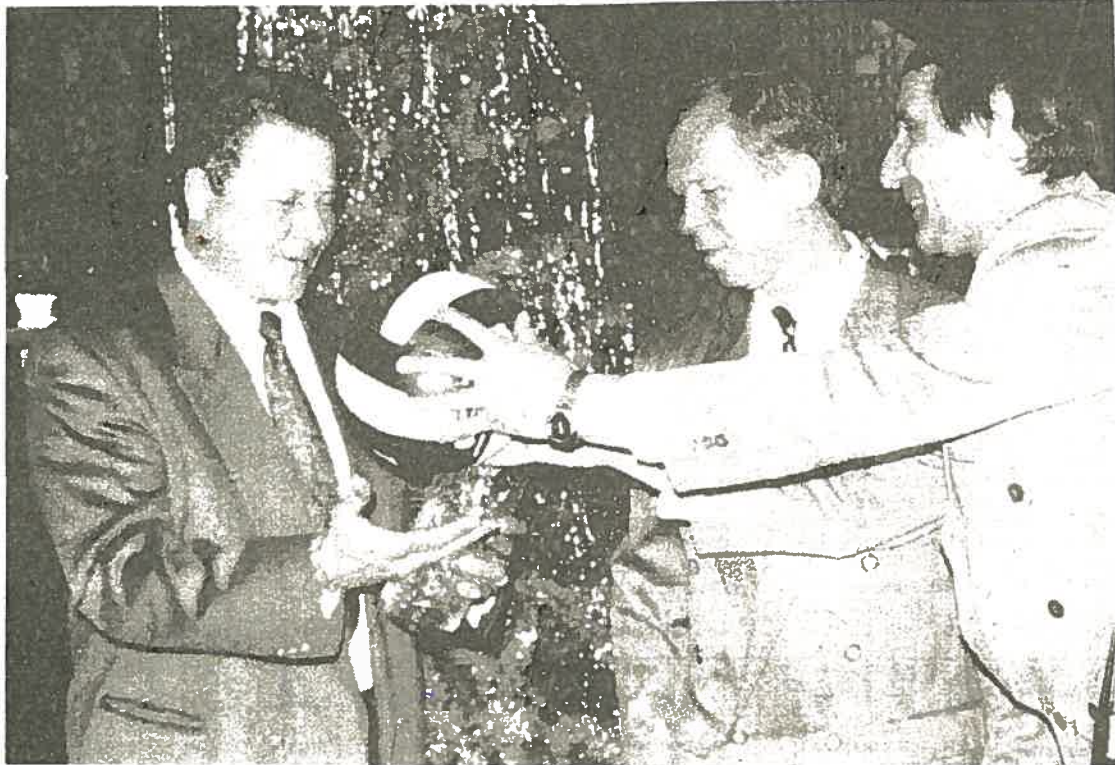
На снимке: момент вручения сувенира.