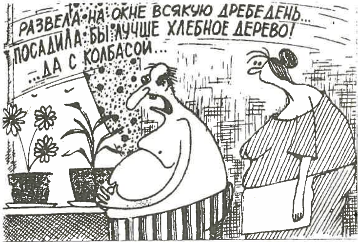
Рис. Михаила ЛАРИЧЕВА