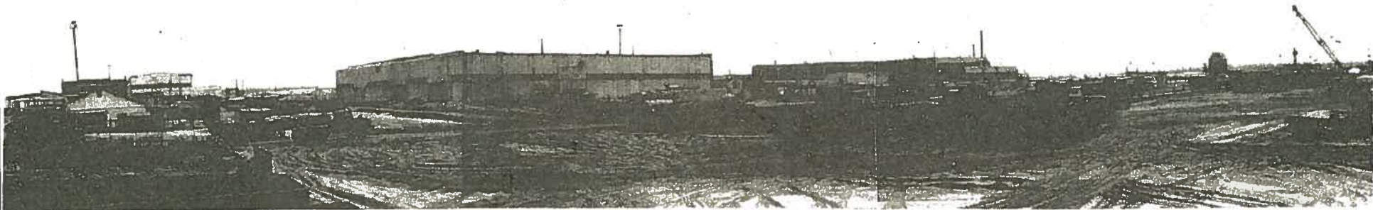
На снимке: фотопанорама АТП-3 ДАО «Спецгазавтотранс».

Если вопросы, о которых я сказал, будут в ближайшее время решены, то наш коллектив безусловно справится с задачами, поставленными перед ним на 1996 год.