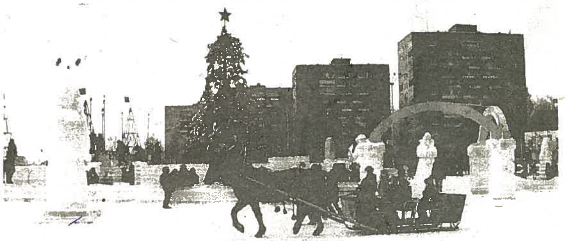
Много радости принесла детворе елка на площади в центре Ижевска.