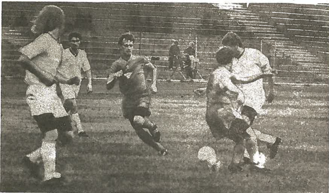
на снимке атакует «Газовик-Газпром».