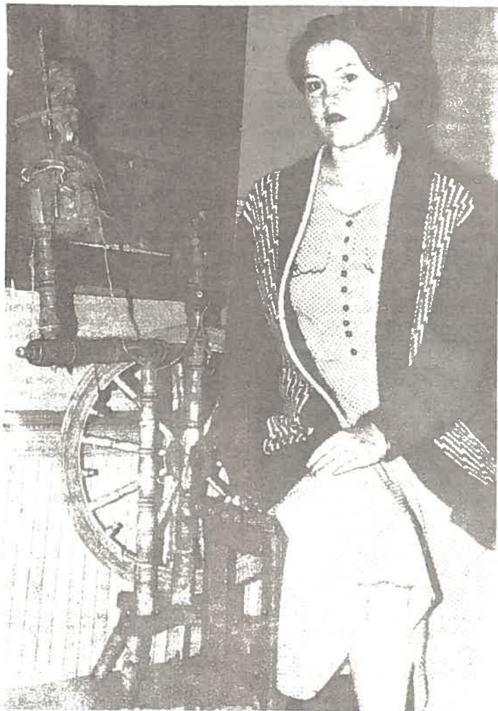
В Удмуртском краеведческом музее проходит выставка "Финно-угорский мир". Экспозиция музея обширна и рассказывает о быте, традициях и жизни удмуртов. На ней представлены национальные одежды, орудия труда, домашняя утварь. На снимке: работник музея у одного из экспонатов — самопрядки.