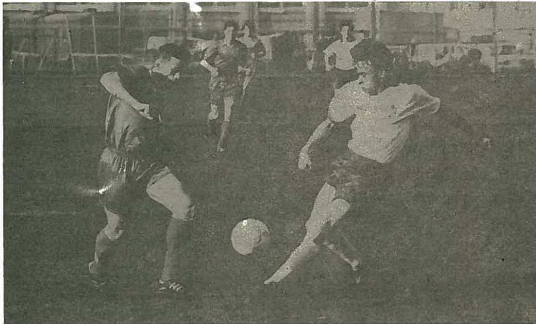
На снимке: момент игры «Газовика» с «Торпедо».