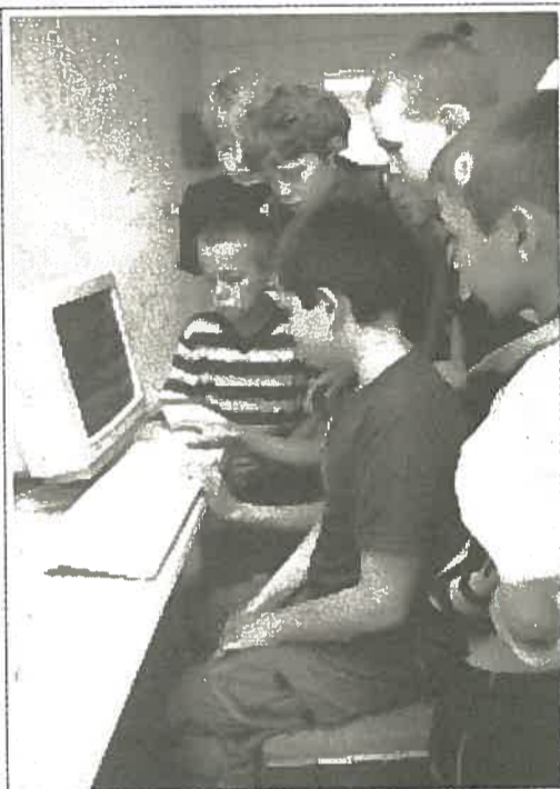
В стране «Интернет» компьютер не скушает.