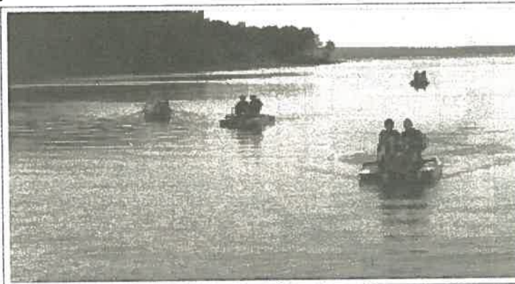
Искупался в Каме -- можно и покататься.

По иному у нас составлен и режим дня. Теперь это уже не режим, а программа (в компьютере же программа). Например, первый ее пункт не традиционный подъем, а «пуск». Затем идет «зарядка сайтов» (физзарядка), «чистка сайтов» (уборка комнат), утренняя «загрузка файлов» (завтрак), «встреча с хакерами» (воспитателями), «работа сайтов» (работа отрядов в кружках),