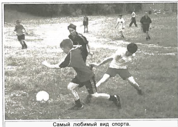
Самый любимый вид спорта.

Задача вожатых и специалистов – максимально задействовать каждого. Для тех же, кого интересует что-то иное, есть еще и биржа труда, где ежедневно вывешивается объем работ и размер оплаты в валюте лагеря «Пламя» — «У.Е.», которая всегда будет кстати в ежедневно работающем магазине, чтобы купить еще один понравившийся за обедом банан или что-либо из кондитерских изделий.