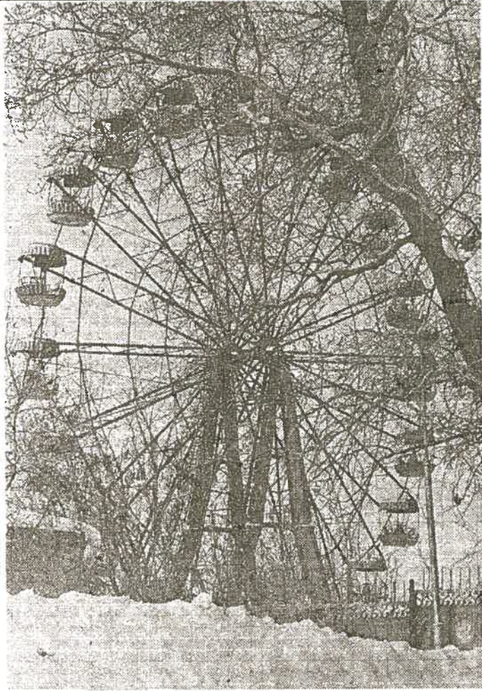
Весеннее небо одно на двоих.

Любителям эстрады не суждено было в этом концертном сезоне увидеть в Глазове популярного певца Валерия Леонтьева. Предполагавшееся выступление российской знаменитости в срочном порядке пришлось отме-