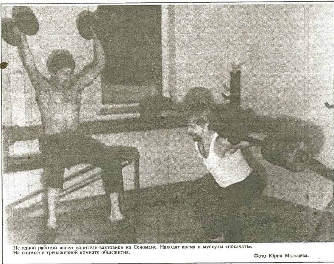
Не одной работой живут водители-вахтовики на Сеномане. Находят время и мускулы «покачать». На снимке: в тренажерной комнате общежития.

1. Вид кузова легкового автомобиля. 2. Ведущий в автомобиле. 3. Прибор для определения пройденного расстояния, счетчик оборотов колеса. 5. Каустическая сода. 7. Первое автомобильное подразделение в российской армии. 9. Основа автопокрышки. 11. Несущая часть грузового автомобиля. 12. Узел управления водным транспортом. 13. Древнегреческий математик. 15. Вид городского транспорта. 17. Принадлежность автомобиля для обеспечения безопасности движения. 18. Приборная панель автомобиля (разг.). 19. Передивчатый звук. 20. Бурный финиш. 22. Насекомое. 23. Мужской голос. 28. Упаковка. 30. Заранее намеченная система деятельности. 32. Точно отмеренное количество. 34. Город в Татарстане. 35. Инструмент для измерения длины. 36. Старинная русская мера длины. 39. Груз пассажира.