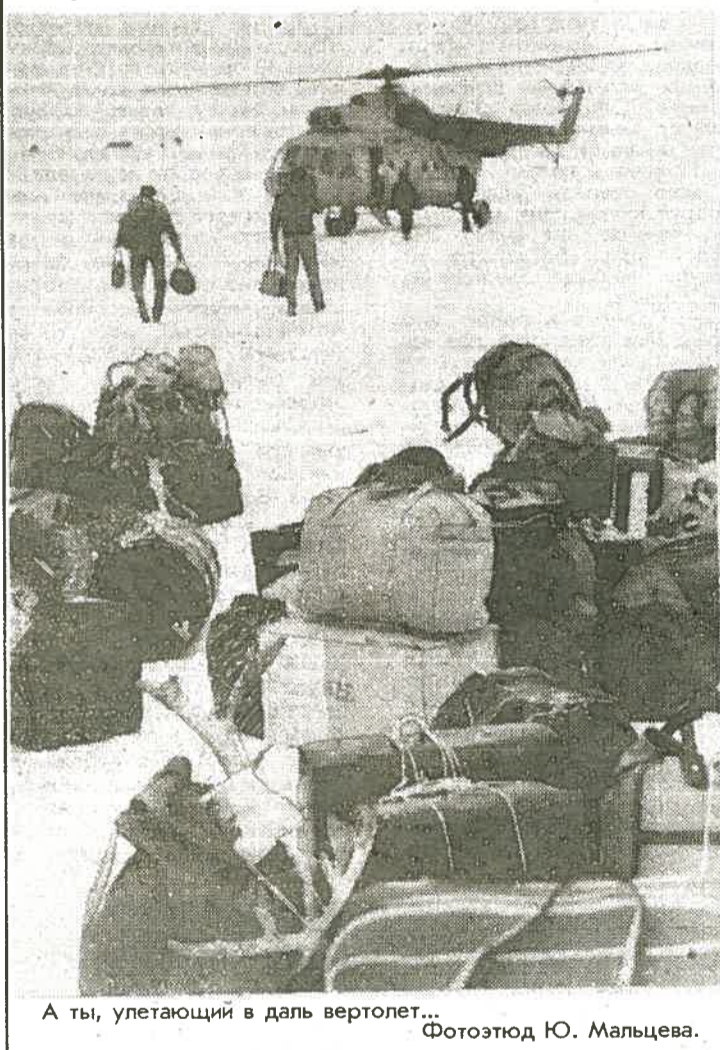
А ты, улетающий в даль вертолет...