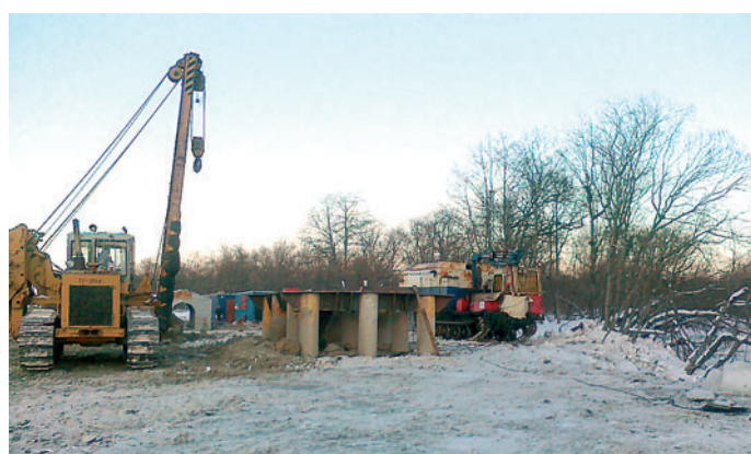
Завершение работ по монтажу опорной части под фермовую конструкцию