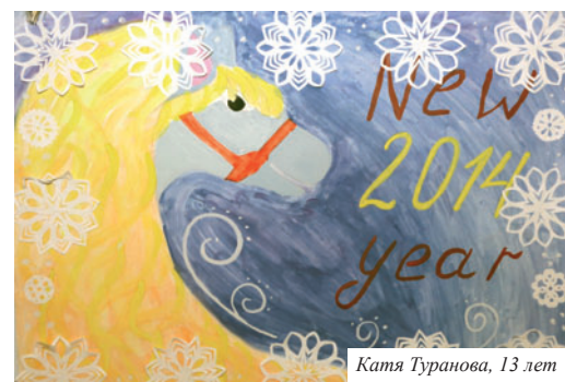
Катя Туранова, 13 лет