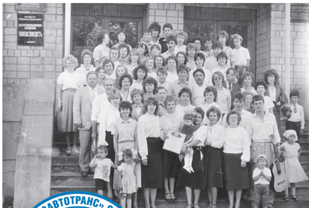
Участники смотр-конкурса эстрадных и народных песен