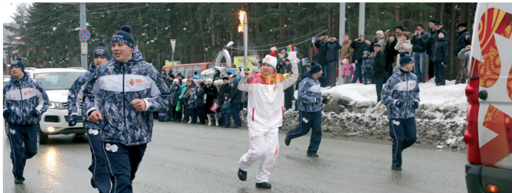
Олимпийский огонь в Ижевске

Пожелаем нашим ребятам удачи и красивых побед!