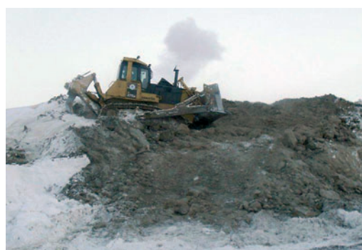
Предварительное рыхление мерзлого грунта