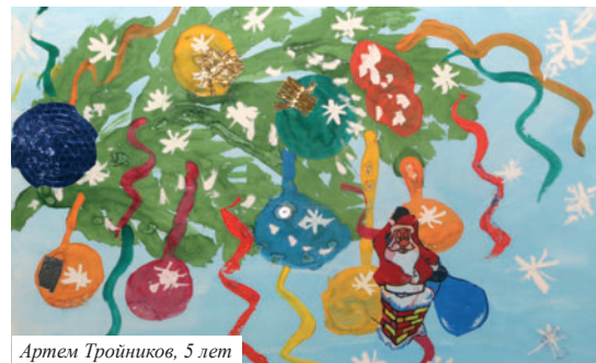
Артем Тройников, 5 лет