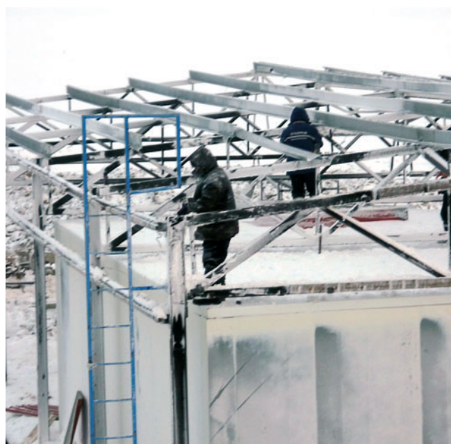
Демонтаж здания в поселке Ямальский