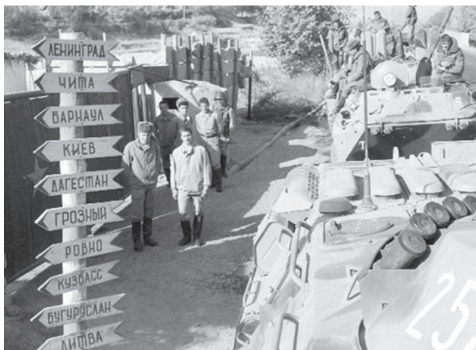
Территория дислокации батальона