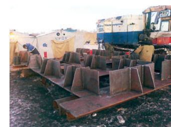
Сборка ростверка под фермовую конструкцию