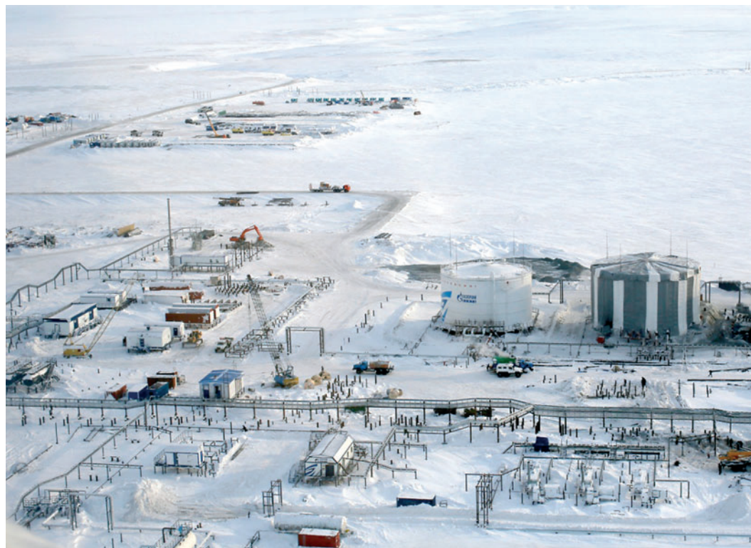
Новопортовское нефтегазоконденсатное месторождение

Новопортовское месторождение находится вдали от транспортной инфраструктуры, и в зимний период главными путями поставки материально-технических ресурсов являются «зимники». Напомним, что Новопортовское нефтегазоконденсатное месторождение расположено на территории Ямальского района ЯНАО в 360 км к северо-востоку от Салехарда, в 30 км от побережья Обской губы.