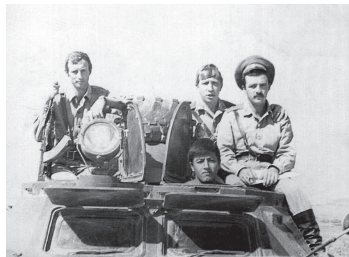
Сопровождение автоколонны на одной из афганских дорог