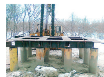
Монтаж опорной части под фермовую конструкцию

До 15 апреля специалисты предприятия должны успеть закончить основное производство работ по монтажу опор трубопровода, ферм перехода, укладке и испытаниям газопровода на резервной нитке через реку Кол-