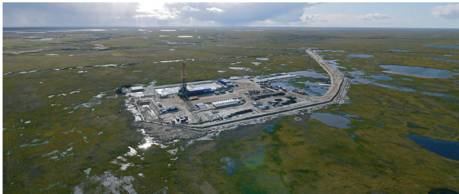
Новопортовское нефтегазоконденсатное месторождение

Новопортовское является самым северным из разрабатываемых нефтегазоконденсатных месторождений Ямала, оно расположено в арктической климатической зоне, на территории Ямальского района ЯНАО вдали от транспортной инфраструктуры. Запасы нефти на этом месторождении превышают 230 млн тонн, а запасы газа – 270 млрд кубометров.