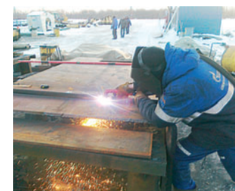
Плазменная резка металла