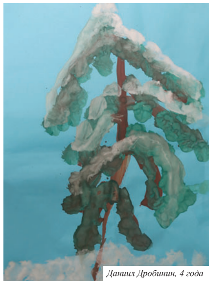
Данил Дробинин, 4 года

Свои работы на новогодней выставке показали дети сотрудников предприятия. Возраст участников — от 4 до 15 лет. На рисунках, поделках из картона, бумаги и пластилина изображены популярные сказочные персонажи, герои детских фильмов, ну и, конечно, символ 2014 года — Лошадь. Сколько старания и желания выразить новогоднее настроение вложили юные художники в свои маленькие шедевры!