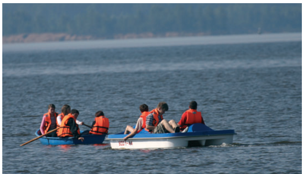
Катание на катамаранах