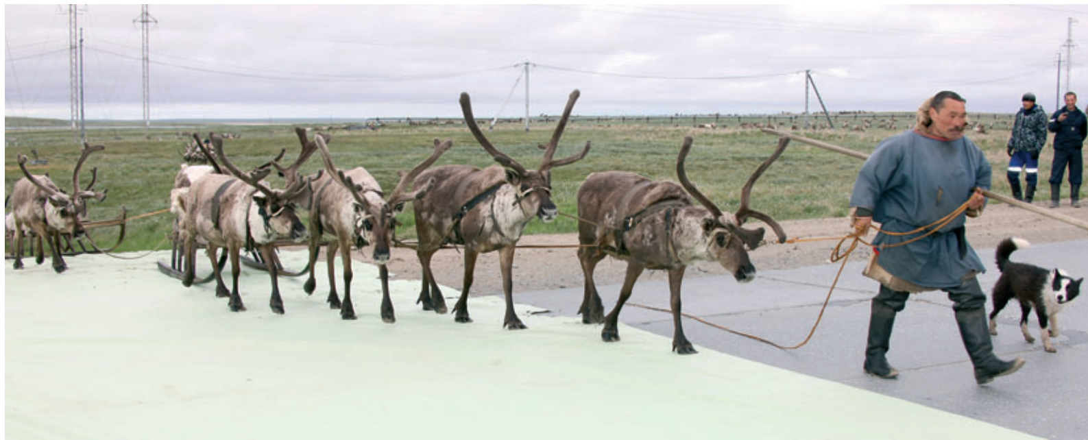
Бригадир первым и переходит через дорогу