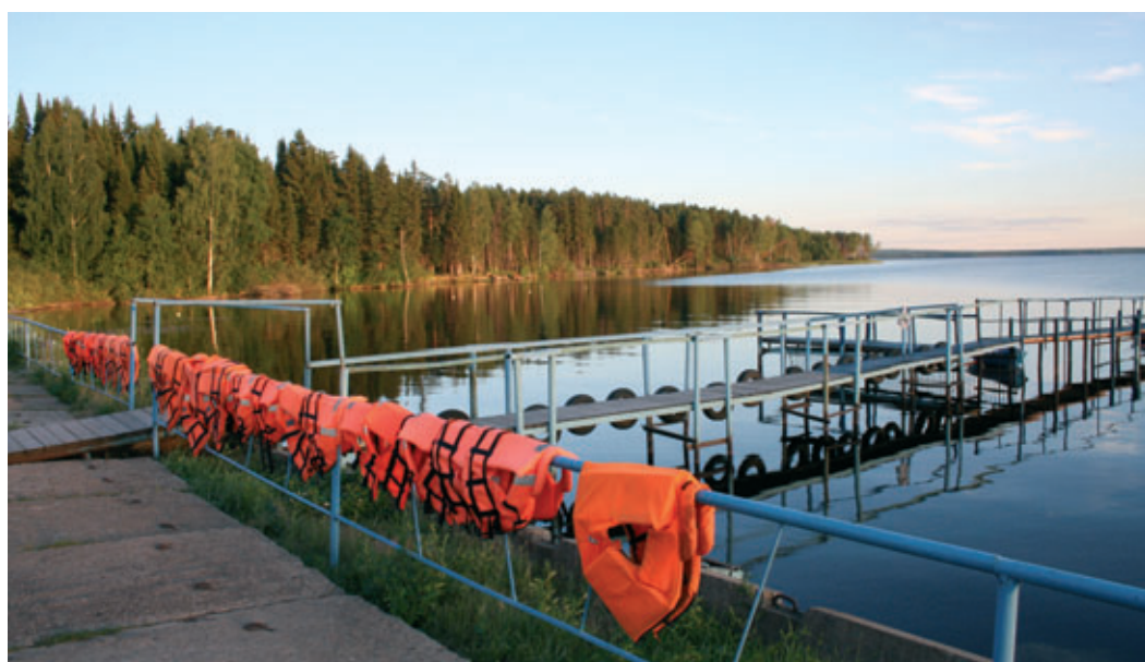
Пристань в затишье