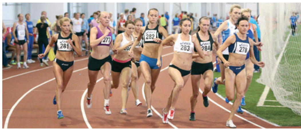
Финальный забег участниц Спартакиады ОАО «Газпром»

пром трансгаз Екатеринбург», третье – команда ООО «Газпром трансгаз Москва».