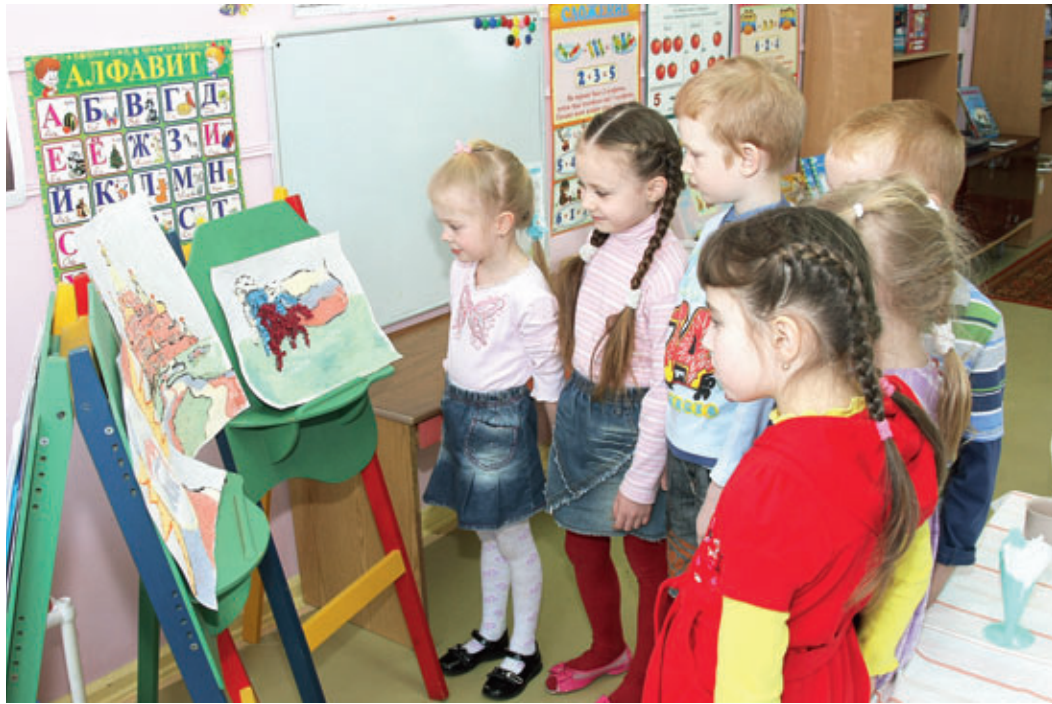
Воспитанники детского сада № 193

Если долго-долго-долго В самолете нам лететь, Если долго-долго-долго На Россию нам смотреть, То увидим мы тогда И леса, и города, Океанские просторы, Ленты рек, озера, горы... Мы увидим даль без края, Тундру, где звенит весна. И поймем тогда, какая Наша Родина большая, Необъятная страна.