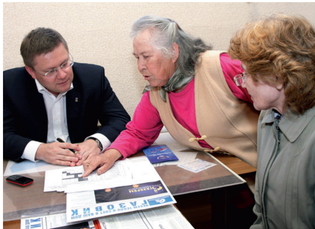
В общественной приемной