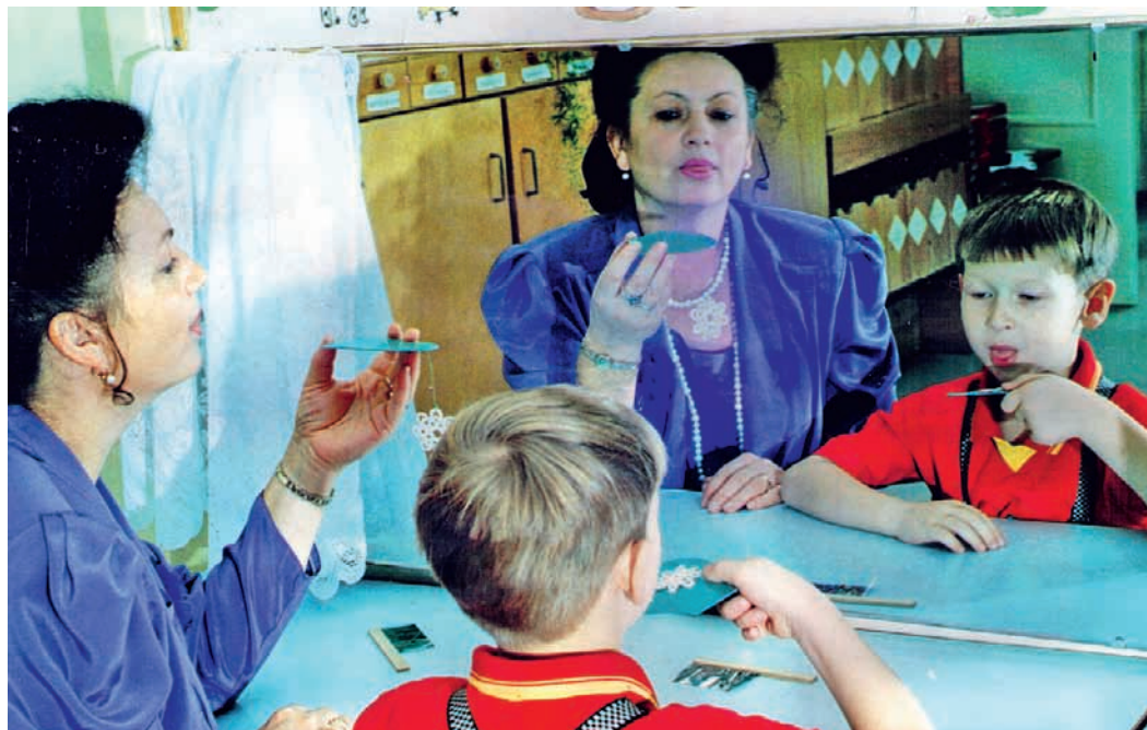
Занятие с логопедом

Следует различать физиологическое (жизненное) и речевое дыхание, которые значительно отличаются друг от друга. Физиологическое дыхание призвано поддерживать жизнь в организме путем газообмена и складывается из вдоха и выдоха, которые сменяют друг друга.