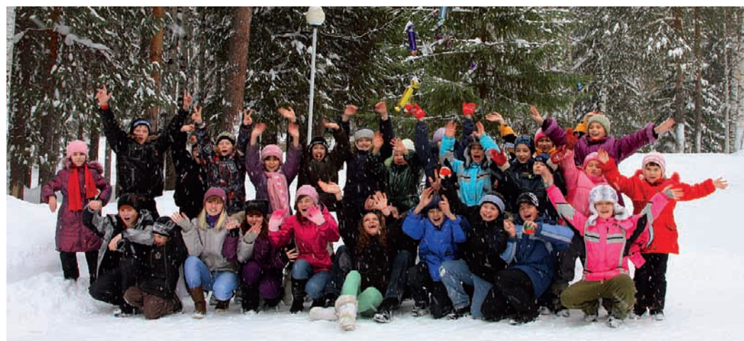
Дети сотрудников ДОО «Спецгазавтотранс»

– За эти каникулы я столько накатался на лыжах, коньках и тюбингах, сколько дома за всю зиму не катался.