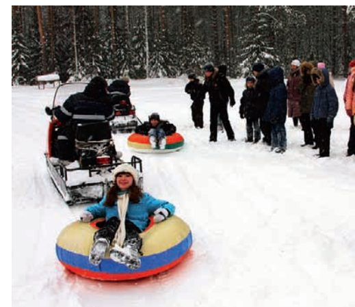
Катание на тюбингах