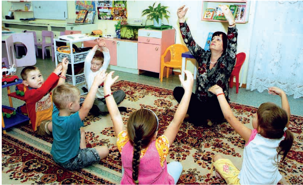
Упражнения на дыхание

Наша речь осуществляется благодаря работе органов, принимающих участие в речевом акте. Чтобы научить ребенка владеть голосом, надо, прежде всего, научить его правильно дышать. И та и другая функции выполняются одними и теми же органами. Без правильного дыхания невозможна хорошо звучащая речь.